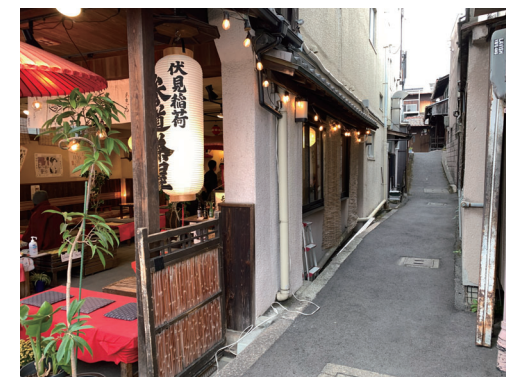
▲路地入口現況写真